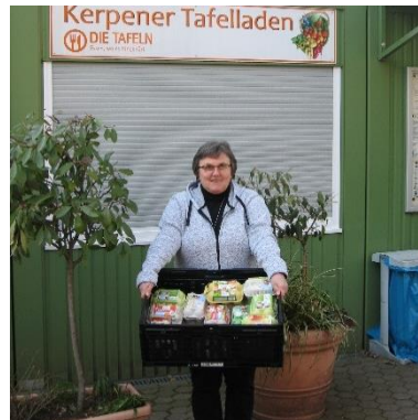
Engagement in Deutschland (1): Kerpener Tafel