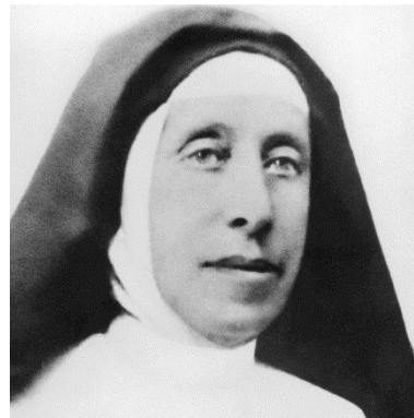
Mutter Maria von den Aposteln, Mitgründerin weiblicher Zweig