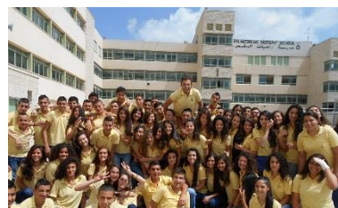
Engagement weltweit: Salvatorische Schule Nazareth