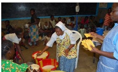
Engagement weltweit: Ernährungszentrum in der DR Kongo