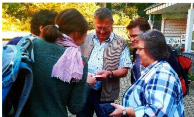
Engagement in Deutschland (2): Bildungshaus