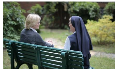
Engagement in Deutschland (3): Gespräche und Seelsorge